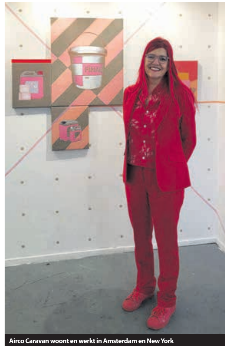
Airco Caravan woont en werkt in Amsterdam en New York

Amsterdam - 'Gifmoorden' is een serie installaties met 'mis-en-place' gifrecepten: een fles Beerenburg, Rua Vieja, haargroeimiddel, koelvloeistof, een pot pindakaas van Calvé en hagelslag van De Ruijter. Ernaast het potje gif of zware slaappillen. Ze kocht zelf de spullen waarmee de moorden zijn gepleegd. 'Dat kun je allemaal online kopen. Sommige moesten met Bitcoins worden afgerekend en dat voelde wel een beetje schimmig. De man die Natruimazide in de boterham pindakaas met hagelslag verwerkte was chemicus. De vrouw die de koelvloeistof in een toetje voor haar man deed, had hetzelfde tien jaar eerder bij haar vorige man gedaan. Toen haar nieuwe man na vergelijkbare ziekteverschijnselen stierf, kreeg de politie argwaan en is ze opgepakt.'